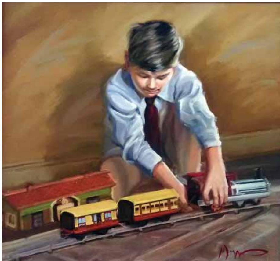
Μαργαρίτα Κοβάλσκα Πεταλίδου «Το τρένο»* 60x60 εκ. Λάδι σε καμβά