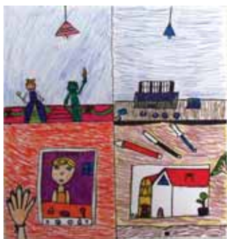
Αβράμη Μιχαηλία Παναγιώτα