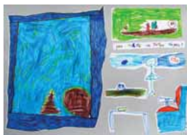
Καλογεράκης Μάριος Λουκάς