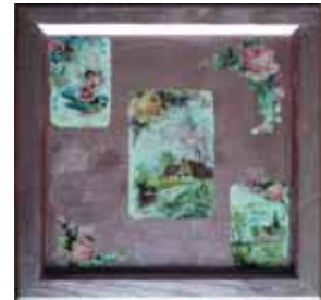
παιχνίδι στην εξοχή Βασιλική -Δ1- 11 Δ.Σ. Ιλίου