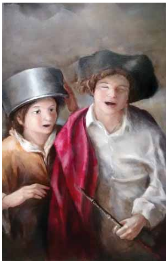
Μάξιμος Μανώλης «Παιχνίδι» 70x100 εκ. Λάδι σε καμβά