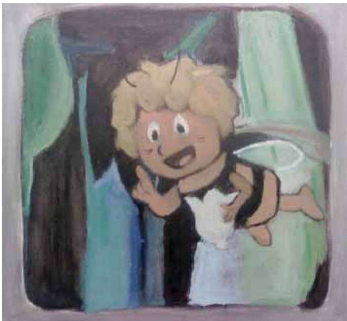
Ελένη Παπανικολάου «Μάγια η μέλισσα»* 40x40 εκ. Ακρυλικό σε καμβά