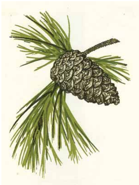
Θεοδώρα Χανδρινού «Περιβαλλοντική εκπαίδευση»* «Dialogue with nature» 10x13,5 εκ. Χαρακτικό σε πλάγιο ξύλο