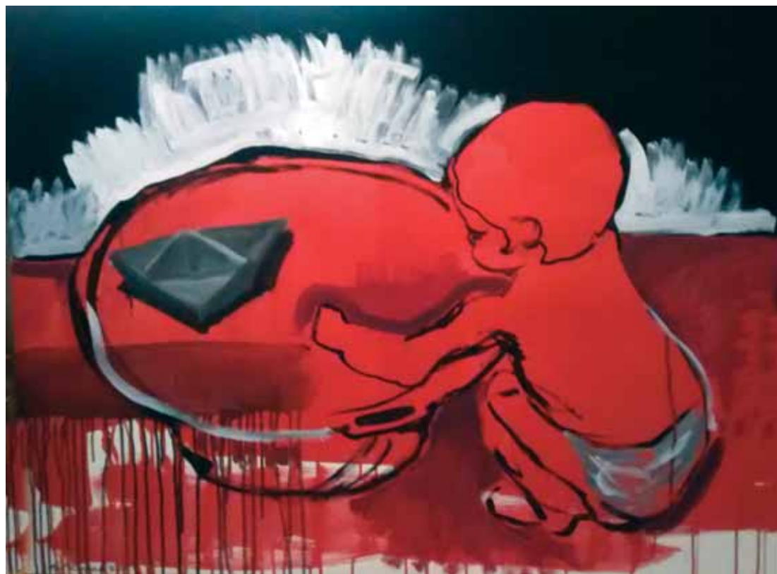
Πένυ Κωνσταντίνου «Ο Παναγιωτάκης με το καραβάκι»* 80x100 εκ. Λάδι σε καμβά