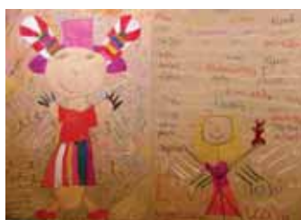
Γκότση Μαύρα Μαρία