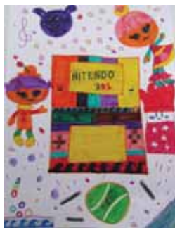
Παγκαλάκη Νικολέτα Παντελόπουλος Ιωάννης