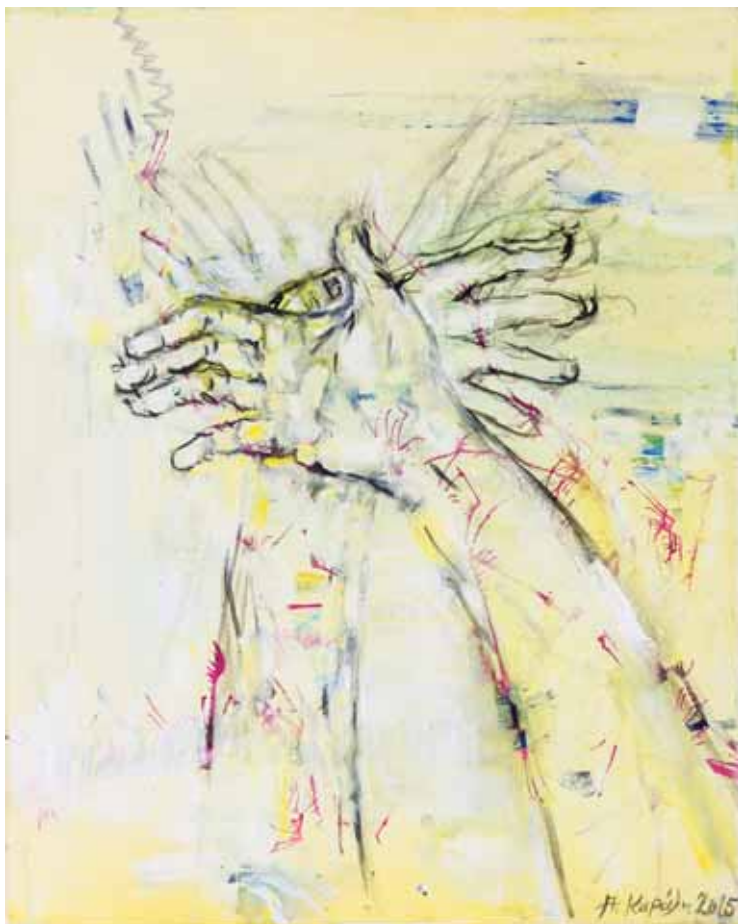
Αγγέλα Καράλη «Ψυχανεμίσματα»* 40x30 εκ. Λάδι σε καμβά