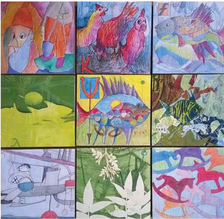
Δημήτρης Μηλιώτης «Αναφορά στο παιχνίδι με τους κύβους»* 15x15 εκ. έκαστο Μεική Τεχνική (Ζωγραφική - Χαρακτική)