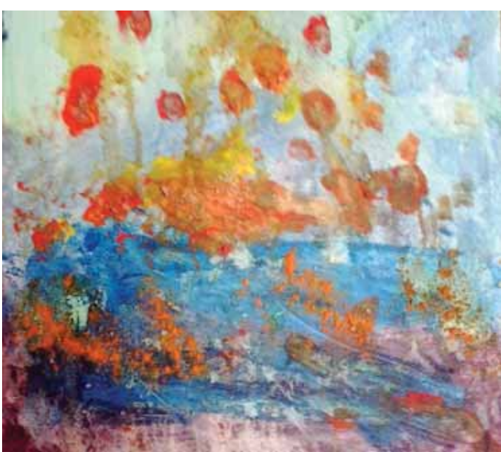
Nuria Gonzalo «Παιδική φαντασία»* «Childhood illusion» 30x30 εκ. Μεικτή τεχνική