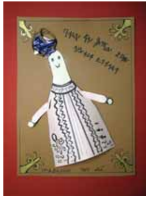
παιδί και παιχνίδι στην αρχαία Ελλάδα - Δ2- 13 Δ.Σ. Ιλίου