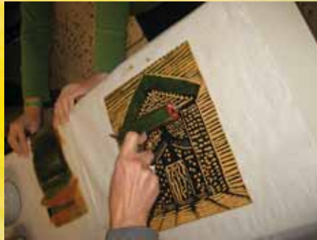
Η διαδικασία του μελανώματος