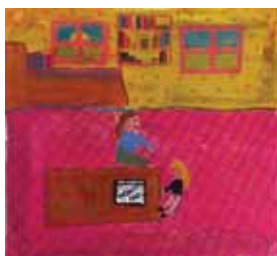
Κάλθι Άννα Μαρία