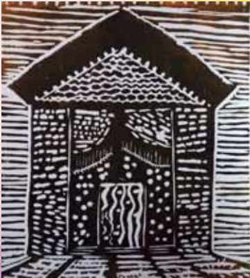
«Το σπίτι των παιχνιδιών» Χαρακτικό σε λινόλεουμ

Με την καθοδήγηση της ζωγράφου-χαρακτριάς Θεοδώρας Χανδρινού