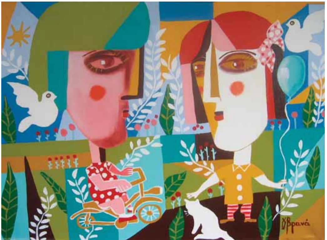
Γιούλη Βρανά «Παιχνίδι στην εξοχή»* 60x80 εκ. Λάδι σε καμβά