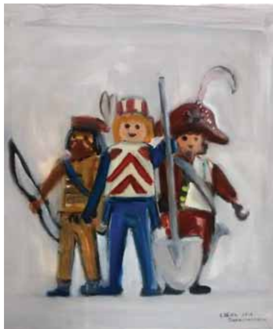
Ελένη Παπανικολάου «Playmobil»* 40x40 εκ. Ακρυλικό σε καμβά