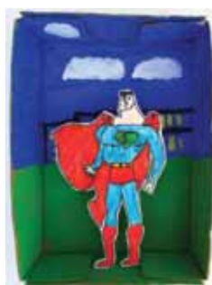
Γάντζος Ευάγγελος Ελευθέριος