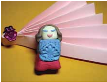
η κούκλα Σοφία -ΣΤ- 11 Δ.Σ. Ιλίου