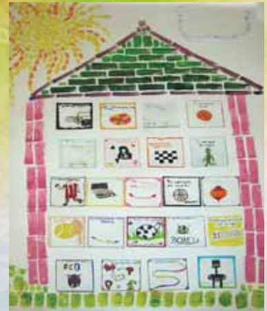
«Το σπίτι των παιχνιδιών» Τύπωμα