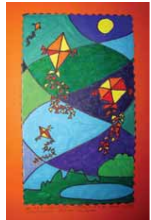
χαρταετοί Αγγελική Ραφαέλα -Δ2- 11 Δ.Σ. Ιλίου