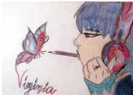
Χωρίς τίτλο Virginia -Colegio San Jose- Spain