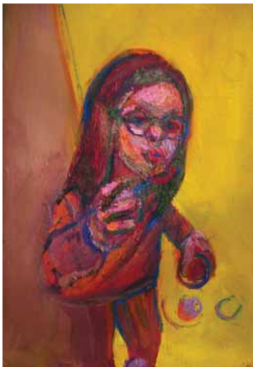
Κων/να Παρασκευοπούλου «Χωρίς τίτλο» * 30x40 εκ. Λάδι σε καμβά