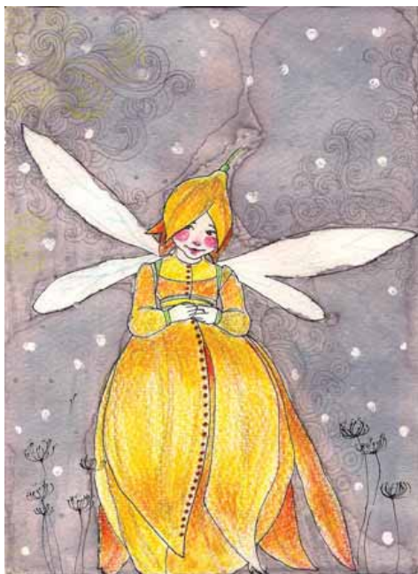
Βασιλική Μπλούκου «Νεράιδα 1» * 12,5 x 17 εκ. Μελάνι, ξυλομπογιές και μαρκαδόροι σε χαρτί