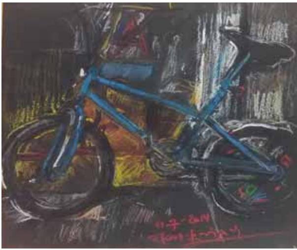
Πέτρος Κουφοβασίλης «Το ποδήλατο»* 29,5x29,5 εκ. Παστέλ και κιμωλία σε χαρτόνι