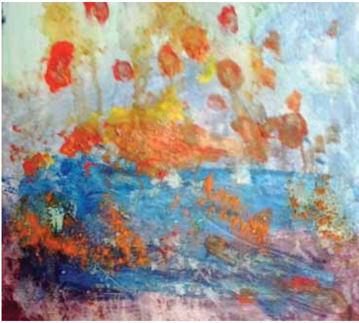
Nuria Gonzalo «Παιδική φαντασία»* «Childhood illusion» 30x30 εκ. Μεικτή τεχνική