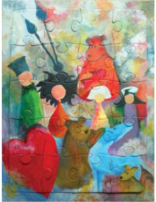
Esperanza Caro – Perdigon «Ιστορίες σε πάζλ – Stories in puzzle»* 28,5x21 εκ. Μεικτή τεχνική