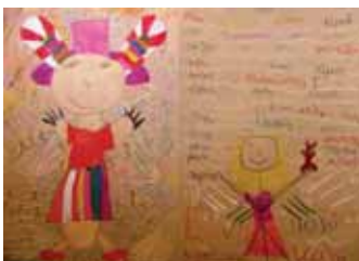
Γκότση Μαύρα Μαρία