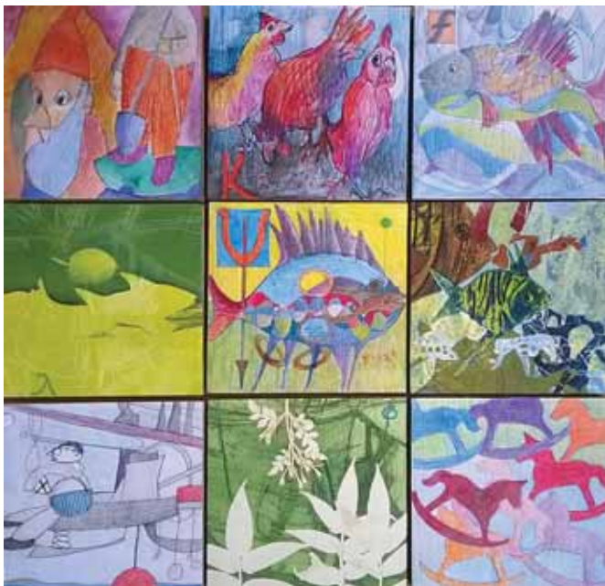
Δημήτρης Μηλιώτης «Αναφορά στο παιχνίδι με τους κύβους» * 15x15 εκ. έκαστο Μεικτή Τεχνική (Ζωγραφική - Χαρακτική)