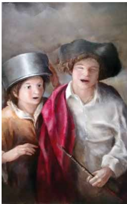
Μάξιμος Μανώλης «Παιχνίδι» 70x100 εκ. Λάδι σε καμβά