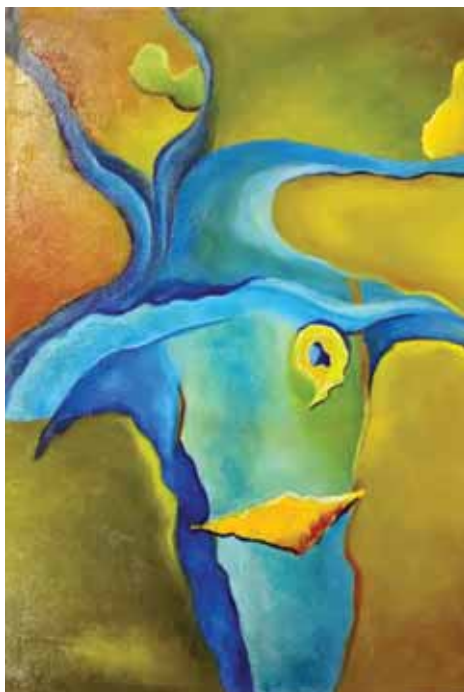
Marinela Rusu «Το παιχνίδι στο υποσυνείδητο» * «Game» 30x40 εκ. Λάδι σε καμβά