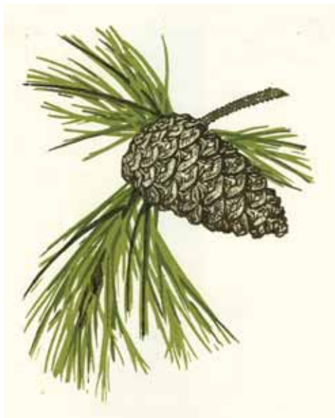
Θεοδώρα Χανδρινού «Περιβαλλοντική εκπαίδευση»* «Dialogue with nature» 10x13,5 εκ. Χαρακτικό σε πλάγιο ξύλο