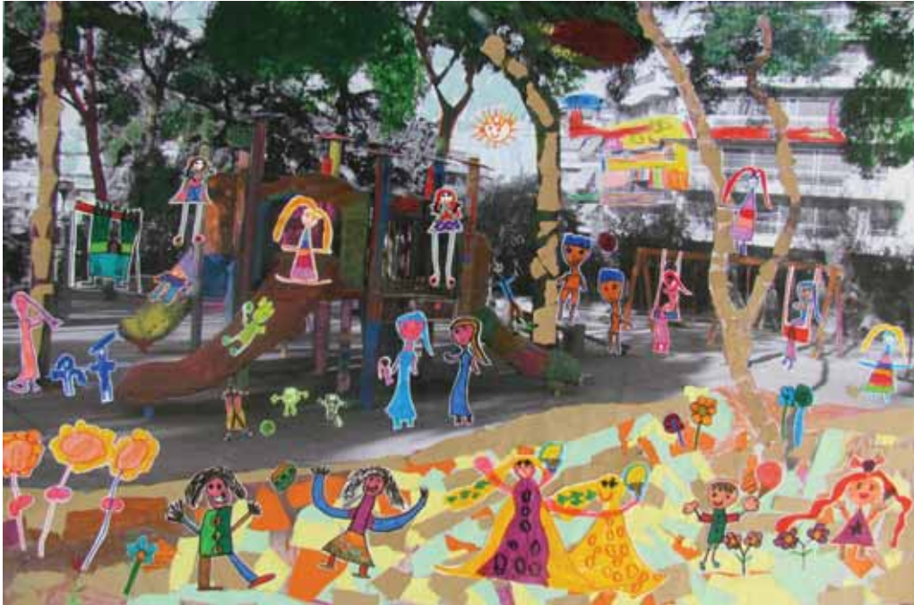
Ομαδικό έργο «Παιδική χαρά» Μεικτή Τεχνική

ΑΡΖΟΥΜΑΝΙΑΝ ΛΕΒΟΝ, ΒΛΑΧΟΥ ΜΕΛΙΝΑ, ΓΑΛΑΝΟΣ ΙΑΣΩΝ, ΓΙΟΥΒΑΝΑΚΗΣ ΙΑΣΩΝ, ΓΚΕΟΡΓΚΙΕΒ ΚΡΙΣΤΙΑΝ, ΓΡΗΓΟΡΙΑΔΗΣ ΑΝΑΣΤΑΣΙΟΣ, ΔΗΜΗΤΡΑΚΑΚΗ ΘΕΟΔΟΣΙΑ, ΔΗΜΗΤΡΟΠΟΥΛΟΥ ΜΑΡΙΑ, ΙΩΑΝΝΙΔΗΣ ΚΩΝΣΤΑΝΤΙΝΟΣ, ΚΑΛΑΝΤΕΡΗ ΑΛΕΞΑΝΔΡΟΣ, ΚΑΤΗΣ ΛΑΖΑΡΟΣ, ΚΟΓΙΑΣ ΓΕΩΡΓΙΟΣ, ΚΟΛΛΙΑΣ ΓΕΩΡΓΙΟΣ, ΚΡΙΘΑΡΟΥΛΑ ΝΑΤΑΛΙΑ, ΚΩΤΟΥΛΑΣ ΣΠΥΡΙΔΩΝ, ΛΥΣΙΚΑΤΟΥ ΗΛΕΚΤΡΑ, ΜΑΚΡΟΠΟΔΑΡΑΣ ΙΑΣΩΝ ΑΘΑΝΑΣΙΟΣ, ΜΠΑΡΙΤΑΚΗ ΕΥΣΤΑΘΙΑ, ΝΑΝΟΠΟΥΛΟΥ ΝΑΝΟΥ ΑΛΕΞΑΝΔΡΑ, ΝΙΚΟΛΑΟΥ ΙΩΑΝΝΗΣ, ΝΤΑΒΕΛΗ ΜΑΓΙΑ, ΤΡΙΑΝΤΗ ΑΝΔΡΙΑΝΑ, ΤΣΟΥΛΟΣ ΑΝΔΡΕΑΣ