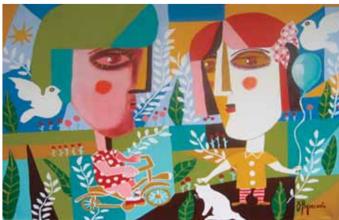
Γούλη Βρανά «Παιχνίδι στην εξοχή» * 60x80 εκ. Λάδι σε καμβά