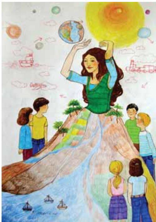
Βασιλική Μπλούκου «Σαν σχολική εκδρομή» * 21 x 30 εκ. ξυλομπογιές και μαρκαδόροι σε χαρτί