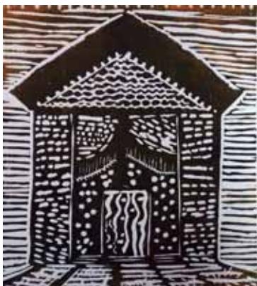
«Το σπίτι των παιχνιδιών» Χαρακτικό σε λινόλεουμ

Με την καθοδήγηση της ζωγράφου-χαράκτριας Θεοδώρας Χανδρινού