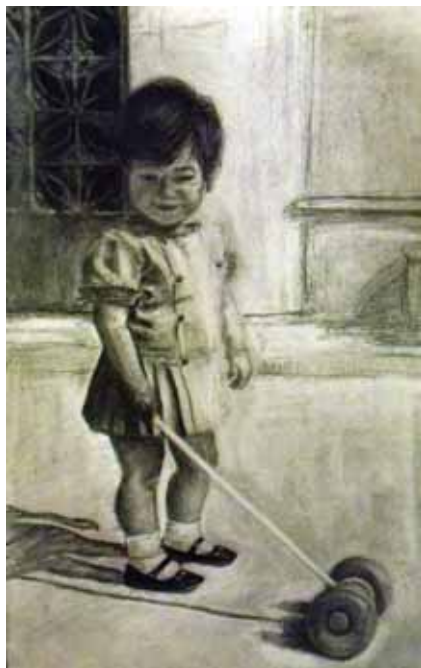
Μαρία Πάστρα «Άτιτλο»* 25x38 εκ. Μολύβι και κάρβουνο σε χαρτί