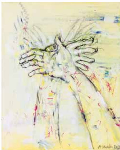
Αγγέλα Καράλη «Ψυχανεμίσματα»* 40x30 εκ. Λάδι σε καμβά