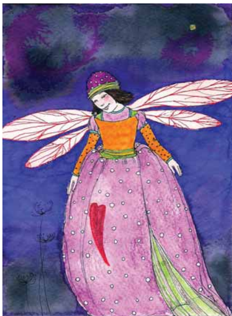
Βασιλική Μπλούκου «Νεράιδα 2» * 12,5 x 17 εκ. Μελάνι, ξυλομπογιές και μαρκαδόροι σε χαρτί