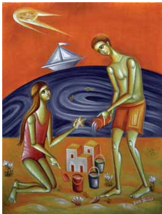
Αλεξάνδρα Τσίγκου «Παιχνίδια στην άμμο» * 30x40 εκ. Αυγοτέμπερα σε χαρτί λόκτα κολλημένο σε ξύλο