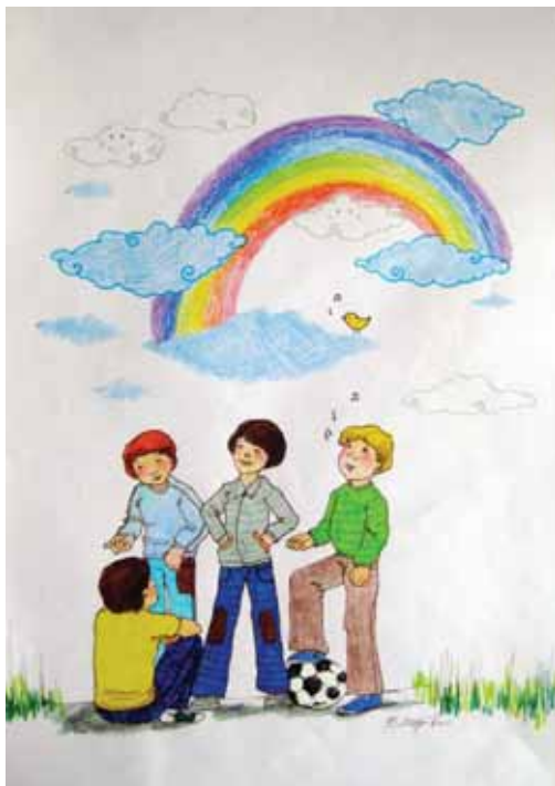
Βασιλική Μπλούκου «Πέρα από το ουράνιο τόξο» * 21 x 30 εκ. ξυλομπογιές και μαρκαδόροι σε χαρτί