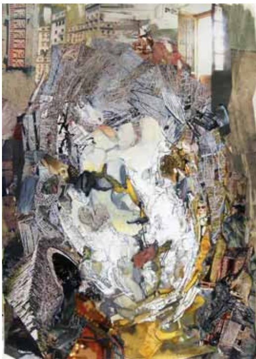
Σοφία Παπαδοπούλου «La rouée» * 30 x 41 εκ. Κολλάζ – μεικτή τεχνική