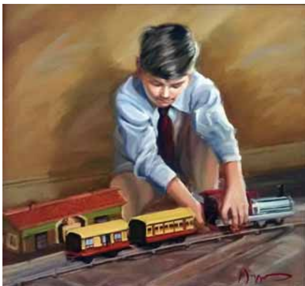
Μαργαρίτα Κοβάλσκα Πεταλίδου «Το τρένο» * 60x60 εκ. Λάδι σε καμβά