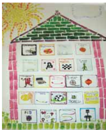
«Το σπίτι των παιχνιδιών» Τύπωμα