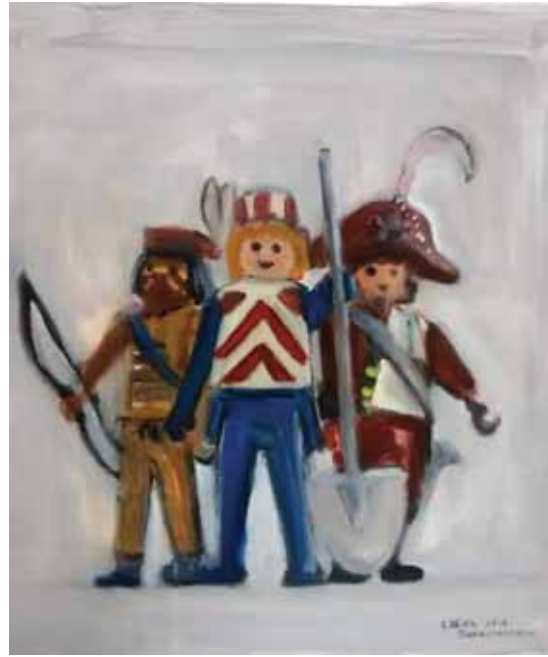
Ελένη Παπανικολάου «Playmobil»* 40x40 εκ. Ακρυλικό σε καμβά