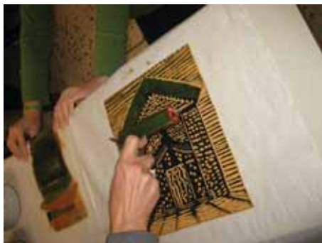
Η διαδικασία του μελανώματος