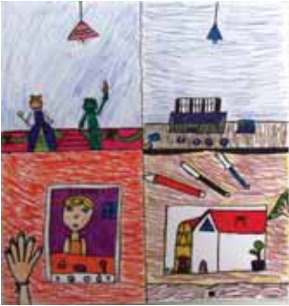
Αβράμη Μιχαηλία Παναγιώτα