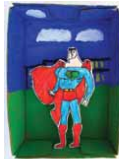
Γάντζος Ευάγγελος Ελευθέριος