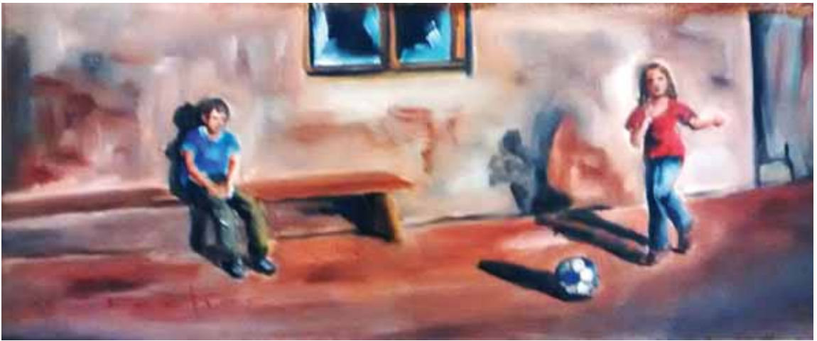
Χρήστος Τσέλιος «Παιχνίδι με μπάλα» * 40 x 17 εκ. Λάδι σε καμβά