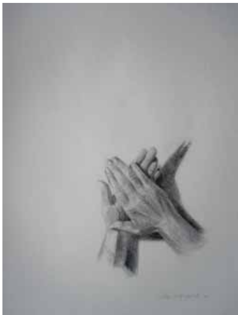
Σοφία Μπακιρτζή «Παιχνίδι με τα χέρια»* 50x70 εκ. Σχέδιο μολύβι σε χαρτί